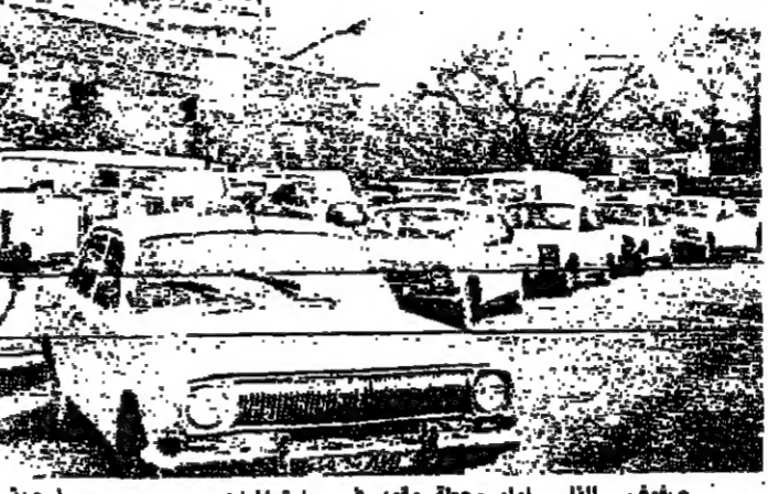
صفوف السيارات امام محطة وقود في ليتوانيا

تخذوا موقفاً صلباً في مواجهة العقوبات التي فرضها الكرملين على ليتوانيا بعد ان اثار غضب موسكو اقرارها الاقتصادي التي فرضتها موسكو عليها. وقال الوزير امس الاول، ودعا الرئيس الليتواني فيتولاس لانديسبرغيس السكان الى تجنب استخدام سياراتهم كلما امكن ذلك. معرباً عن قلقه من ان حشود سيارات لا تتجاوز ثمانية في ليتوانيا ستواجه كلفة ادا لم تتراجع عن موقفاها بشأن الاستقلال. فليونس (ليتوانيا) - ر